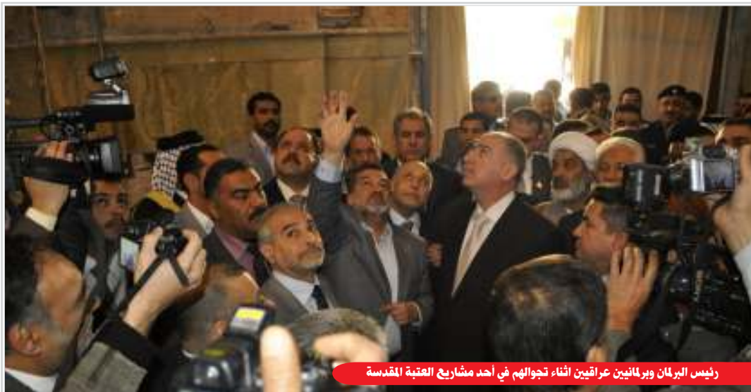
رئيس البرلمان وبرلمانيين عراقيين أثناء تجوالهم في أحد مشاريع العتبة المقدسة