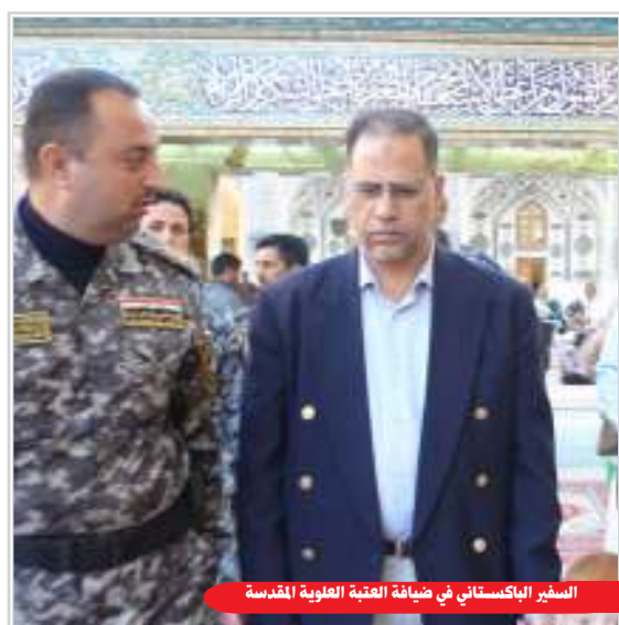
السير الباكستاني في ضيافة العتبة العلوية المقدسة