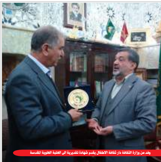
وفد من وزارة الثقافة دار ثقافة الاطفال يقدم شهادة تقديرية الى العتبة العلوية المقدسة