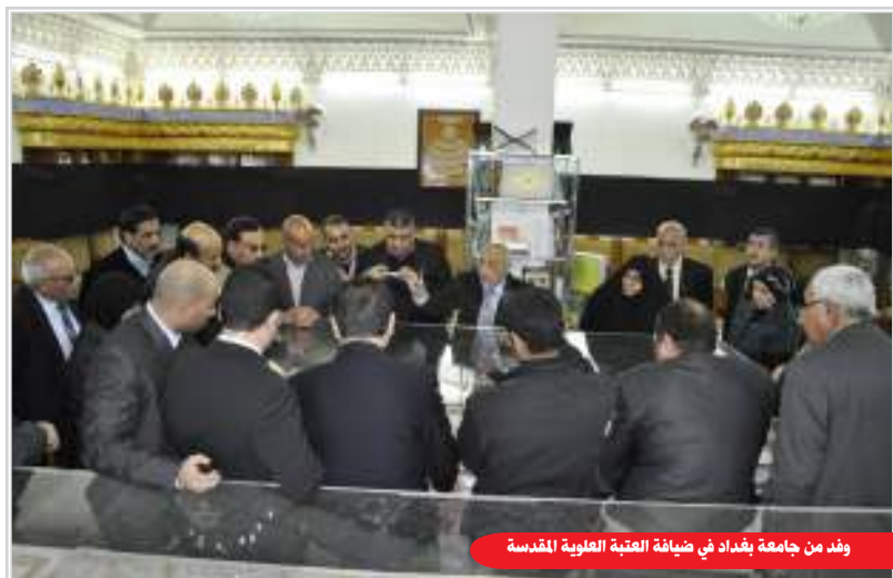
وفد من جامعة بحداد في ضيافة العتبة العلوية المقدسة