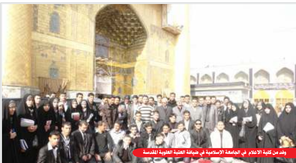
وفد من كلية الاعلام في الجامعة الاسلامية في ضيافة العتبة العلوية المقدسة