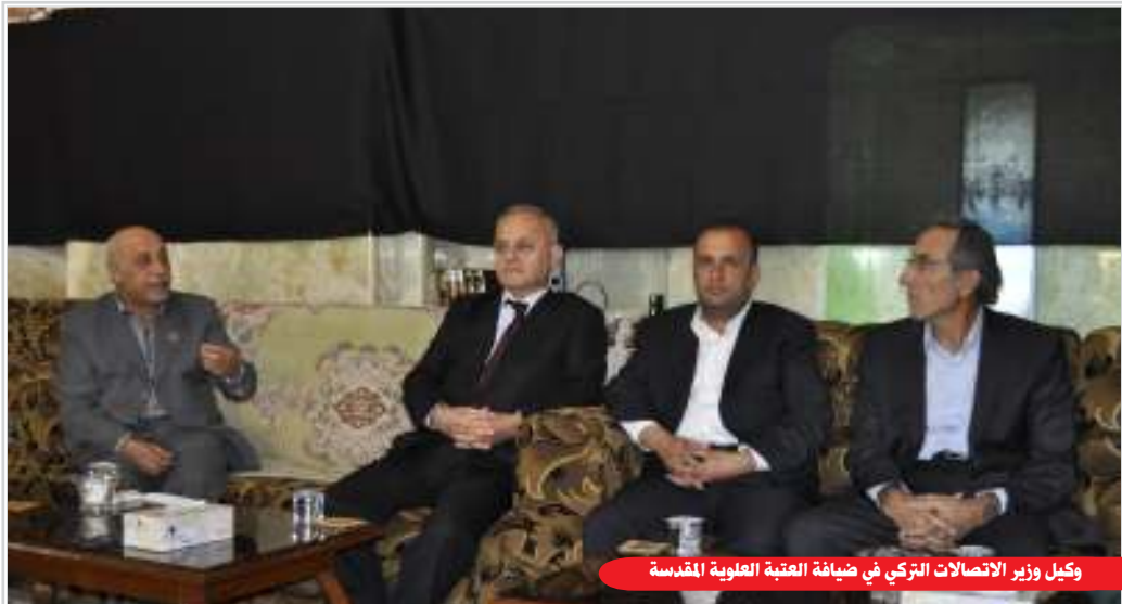
وكيل وزير الاتصالات التركي في ضيافة العتبة العلوية المقدسة