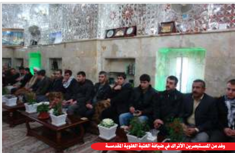
وفد من المستبصرين الأترك في ضيافة العتبة العلوية المقدسة